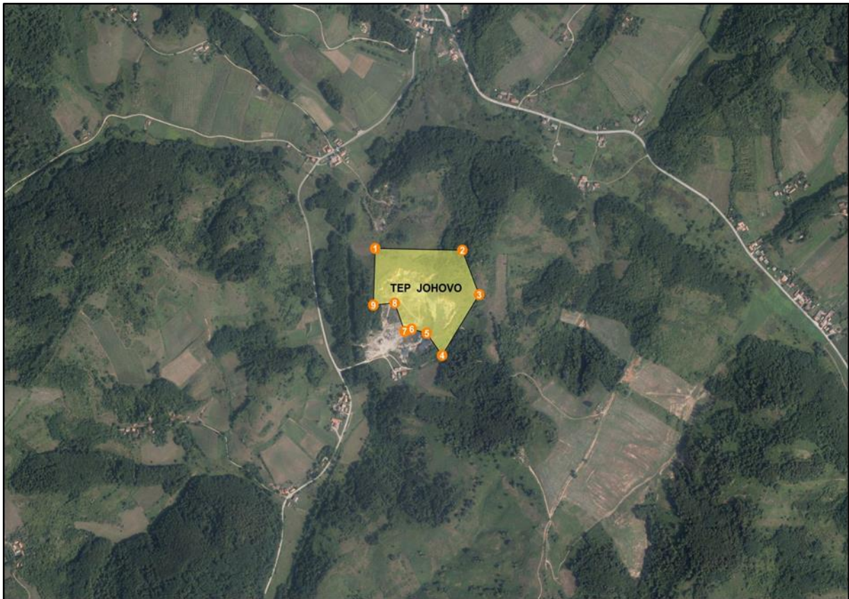
Grafički prikaz traženog eksploatacijskog polja tehničko-građevnog kamena "Johovo"